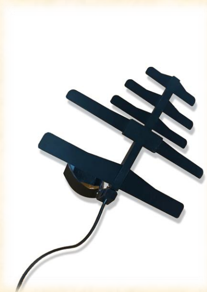
小型室内接收天线